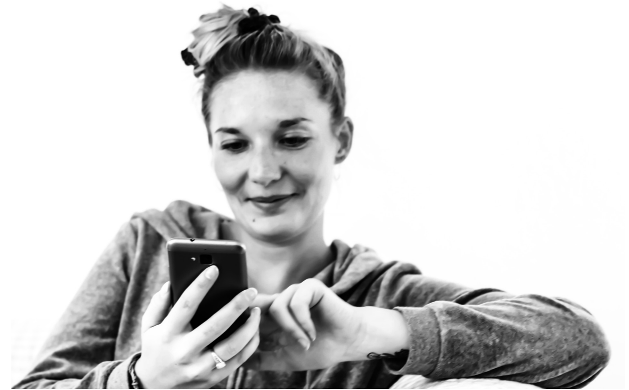
Wandel der Medien: Smartphones gehören inzwischen zum Alltag. Aber kann sie jeder nutzen?